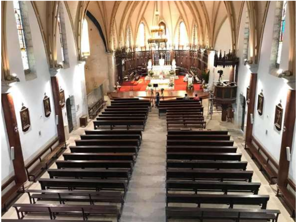
La Nef et le Chœur pendant la rénovation.

On notera que la Chaire a été remise à sa place d'origine.