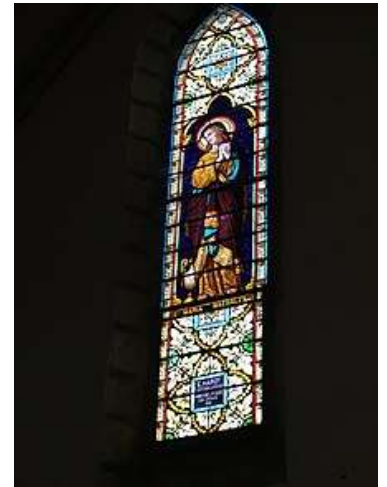
Vitrail à Sainte Marie-Madeleine

Dédiée à Joseph , l'époux de la Vierge Marie dans le Nouveau Testament , la Cathédrale dispose de 28 vitraux représentant différents saints de l' Église catholique romaine et personnages bibliques : (voir plan de la Cathédrale joint avec les noms pour chaque vitrail).